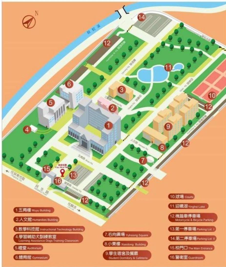
國立屏東大學民生校區平面配置圖 National Pingtung University Minshen Campus Plane Configuration Diagram